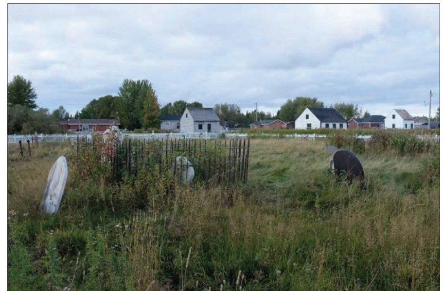
Moose Factory : Cimetière et maisons historiques